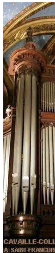
CAVAILLÉ-COLL A SAINT-FRANÇOIS